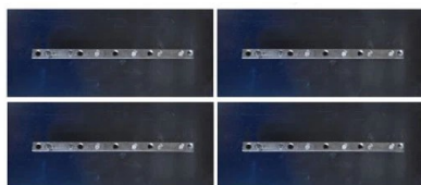
К-кт лопатки за пердашка за бетон 4бр.