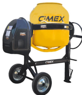
МИКСЕР ЗА БЕТОН 320л.