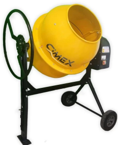
МИКСЕР ЗА БЕТОН 200л.