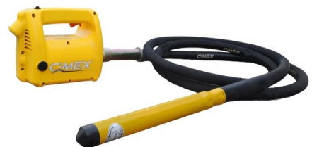
ВИБРАТОР ЗА БЕТОН