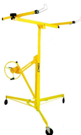
Повдигач за гипскартон CIMEX