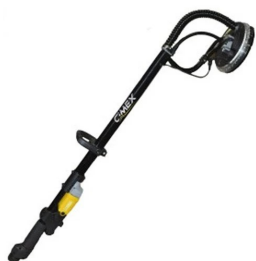
Шлайф машина CIMEX