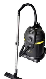
Професионални прахосмукачки CIMEX