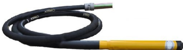
ЖИЛО ЗА ВИБРАТОР ЗА БЕТОН Ф50